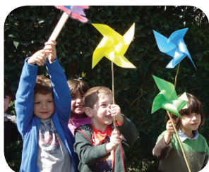
Vacances dans le vent !

🍏 Le centre de loisirs intercommunal de Saint-Médard, le Clos de Césame , sera ouvert du lundi 10 juillet au vendredi 1 er septembre de 7h30 à 18h30. Des vacances sous le thème « Art attitude » pour découvrir le territoire : village Gaulois, labyrinthe de Merville, Saint-Bertrand de Comminges, Abbaye de Bonnefont, Lac d'Auzas, sans oublier les nombreuses activités manuelles, sportives, jeux, contes, balades, etc.