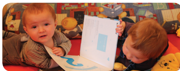
Il était une fois... le livre !

🍏 Le Relais Assistantes Maternelles, le RAM , sera fermé du 31 juillet au 25 août inclus. CONTACT : 05.62.01.55.55 / 06.88.94.46.99