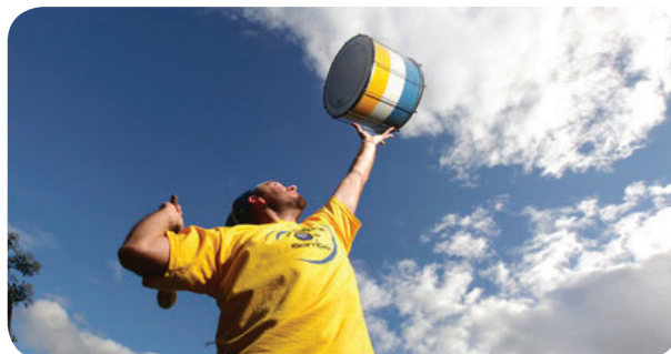
Ambiance batucada pour l'inauguration du festival.

Organisé par la mairie, c'est la 16 e édition de ce festival qui présente tous les arts dans les rues et les boutiques d'Aspet. Expositions, installations artistiques extérieures, concerts, spectacles...les animations sont nombreuses.