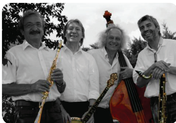
Original Jazzpirine Quartet

Pour la 10 e année, le Foyer rural de Soueich et la commune organisent la Semaine des Arts. Tous les spectacles sont gratuits.