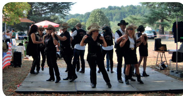
Édition 2016 à Roquefort-sur-Garonne

LES ASSOCIATIONS SOUHAITANT PARTICIPER DOIVENT S'ADRESSER À LA COMMUNAUTÉ DE COMMUNES AU 05.61.98.49.30.