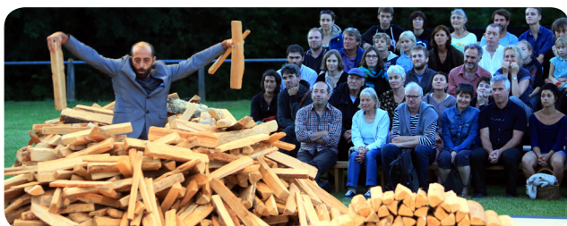
« La Cosa » de Claudio Stellato à Aspet

Du mardi au vendredi 9h-12h30 / 14h30-18h