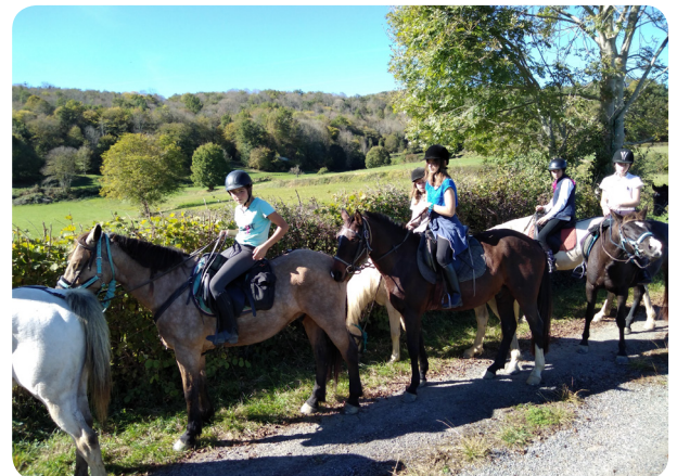
Stage découverte équitation avec Cavalcagire.

❄️ Crèche associative Les Tout-Petits, Saint-Martory La crèche sera fermée du 22 décembre 2017 au 1 er janvier 2018 inclus. CONTACT : Brigitte DI SCALA au 05.61.90.17.45 ccstmartory@orange.fr