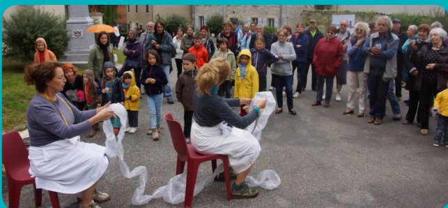
Performance d'Ôssilâ aux Urauquoises