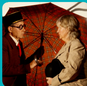
Les Théâtralies à Salies-du-Salat