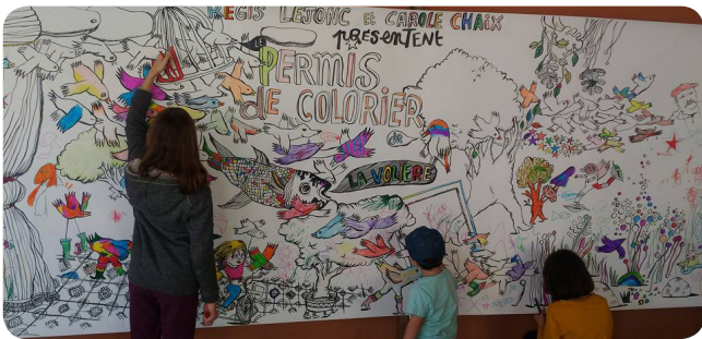
À vos couleurs !

En octobre, la 6 e édition de la Halte Nomade du livre jeunesse a attiré dans les rues d'Aspet plus de 1700 spectateurs. Fil conducteur et temps fort de la semaine, la fresque participative géante « Permis de colorier » créée spécialement pour le festival par l'artiste-illustratrice Carole Chaix.