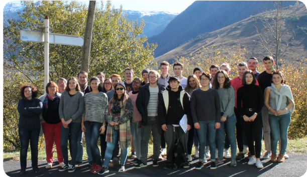
En novembre, les étudiants découvrent le territoire intercommunal.