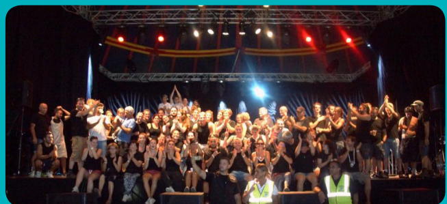
Salies-du-Salat au rythme des Foliescénies