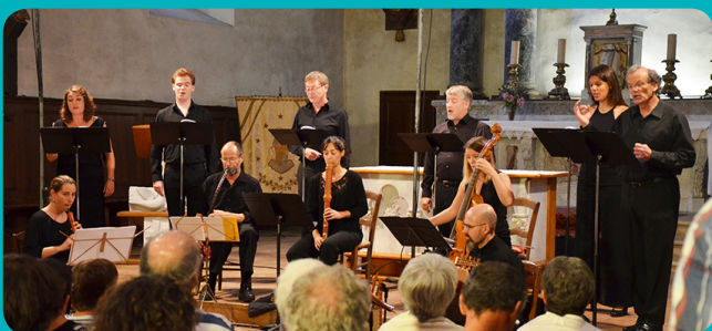
Le Jardin de Musiques à Soueich