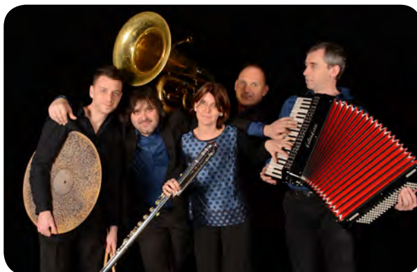
Grand Orphéon

→ SAMEDI 25 AOÛT 21h Proupiary (Bonfont) Grand Orphéon , gratuit.