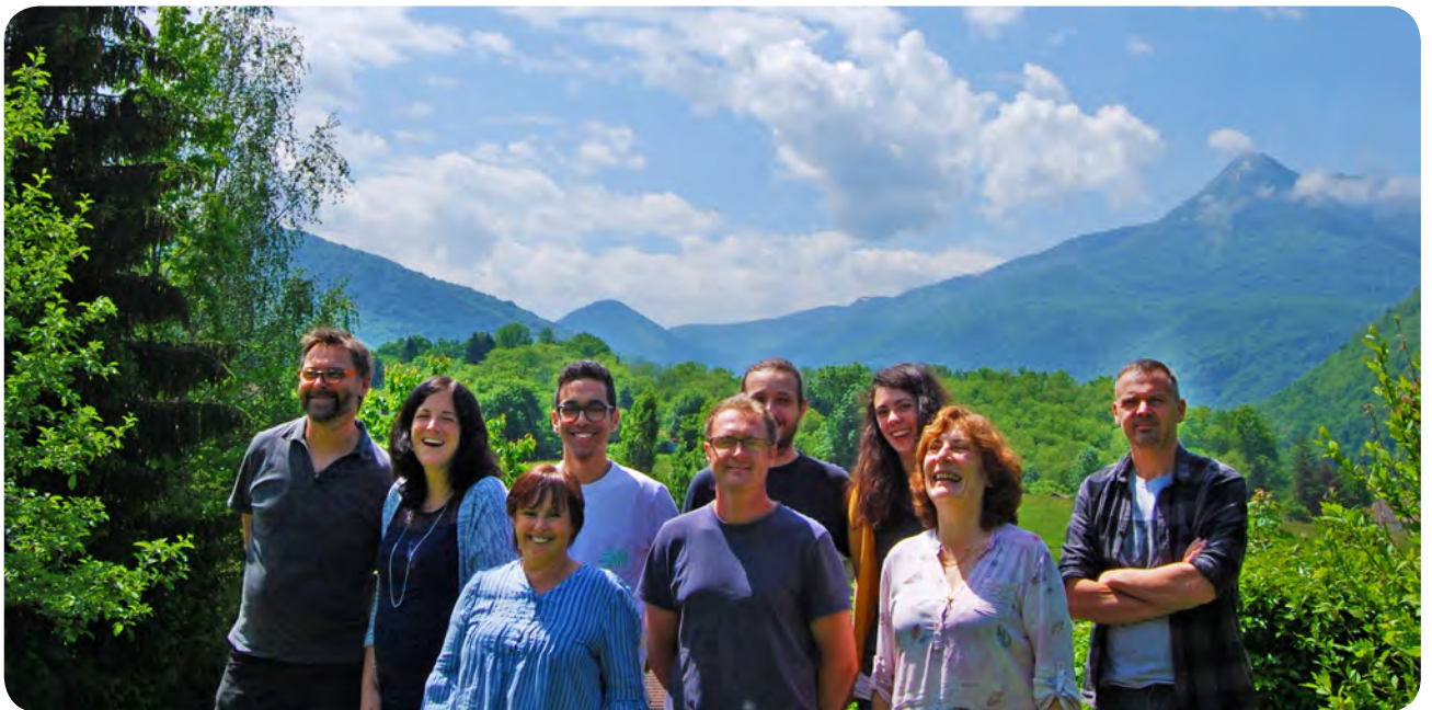
Le piémont pyrénéen à l'approche de l'été, un décor inspirant pour l'équipe de l'Office de Tourisme Communautaire.