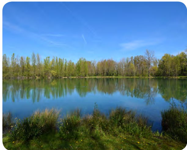
Le lac de Touille est un site naturel et touristique majeur de notre territoire.

Les taux d'imposition des taxes locales ont ainsi été augmentés cette année pour permettre à la communauté de communes d'assurer son fonctionnement et de se créer des marges de manœuvre pour porter des investissements à l'échelle intercommunale.