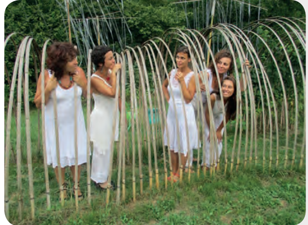
Le LABYRINTHE CRÉAGIRE de Sengouagnet a ouvert ses chemins de juin à septembre pour sa 4 e saison : visites du labyrinthe artistique, spectacles pour petits et grands durant tout l'été au pied du Cagire.