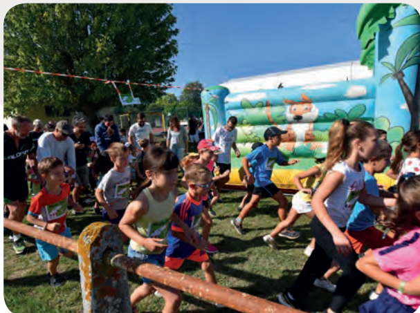
LE FORUM INTERCOMMUNAL DES ASSOCIATIONS à Saint-Martory le 7 septembre.