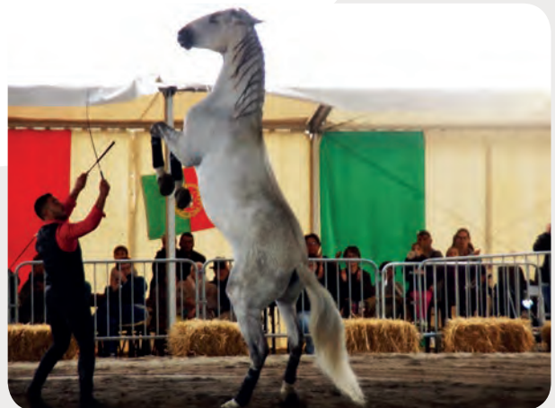
FOLLEMENT CHEVAL à Salies-du-Salat les 21 et 22 septembre. Passionnés de chevaux, de spectacle, amoureux de l'esprit ibérique se sont retrouvés nombreux pour ces rencontres d'art équestre.