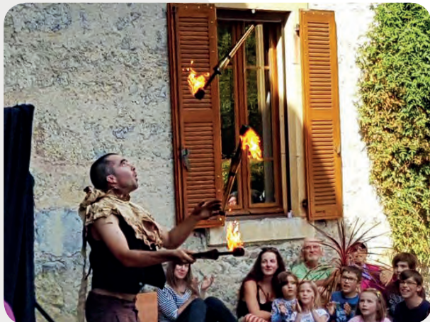
LES URAQUOISES à Urau les 7 et 8 septembre. Magie, dépaysement, franche rigolade, bonne musique d'ici et d'ailleurs, acrobaties, jongleurs de feu, facéties et ballons qui tombent du ciel...