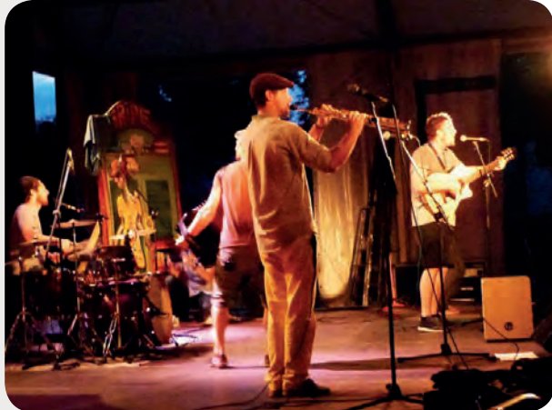
À VOUS DE VOIR - LE FESTIVAL : 10 ans de festival en Arbazonie ! Théâtre, lectures, projections, concerts et déambulations du 11 au 14 juillet à Arbas.