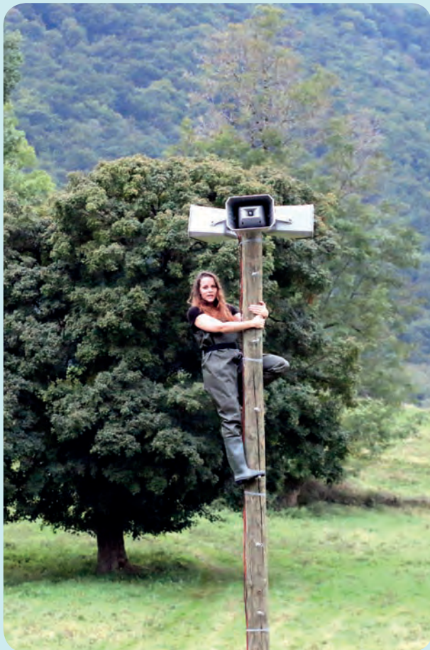
Arts en paysage, c'était le 27, 28 et 29 septembre à Arbas. Invité par Pronomade(s) en Haute-Garonne, Kees Lesuis, le directeur artistique du festival Oerol, le plus grand festival des Pays-Bas, qui se tient chaque été sur l'île néerlandaise de Terschelling, avait carte blanche à Arbas, où a notamment été donné un opéra pour les arbres !

RÉSERVATIONS AUPRÈS DES OFFICES DE TOURISME OU SUR www.pronomades.org