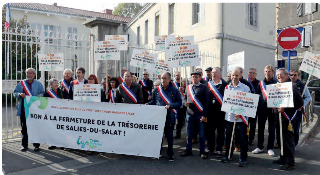
Saint-Gaudens, le 29 octobre devant la sous-préfecture