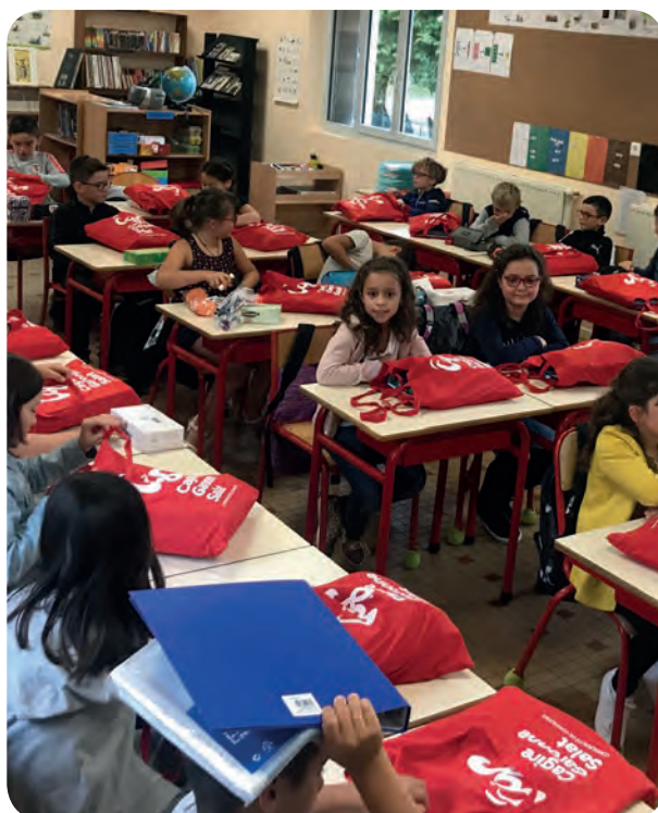
Ecole de Montsaunes-septembre 2019

CONTACT : 05.61.90.22.59 www.apei-jeunesse-31.fr