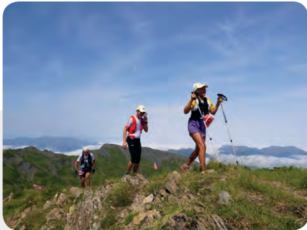
TRAIL DES TROIS PICS , le 21 juillet à Arbas. Une superbe édition 2019 qui a battu nombre de records : plus de 600 participants, 10 équipes en relais, 128 bénévoles. C'est la plus grande participation au trail !