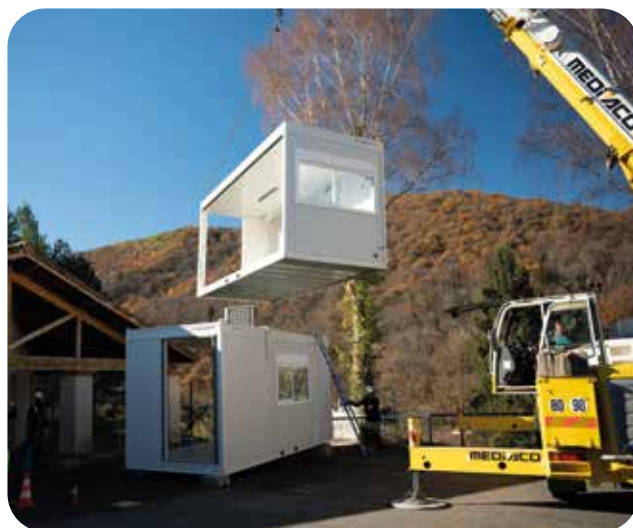
9 décembre installation de préfabriqués pour l'espace restauration

La commission d'attribution des places se tiendra le 12 janvier prochain. Si vous êtes intéressés pensez à vous préinscrire AVANT LE 07 JANVIER 2026 .